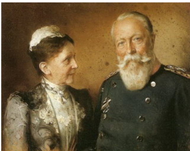
Großherzog Friedrich I. und Gemahlin Luise

Am 20.5.1860 besuchen Großherzog Friedrich I. und seine Gemahlin Luise die wiederhergestellte Mannheimer Sternwarte und bewundern das neue Fernrohr.