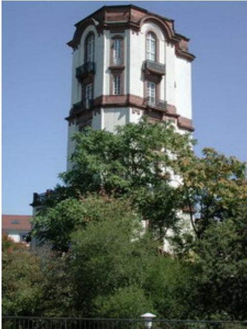
Turm der Mannheimer Sternwarte

Der Präsident der Mannheimer Akademie der Wissenschaften , Baron von Hohenhausen , legt am 1.10.1772 den Grundstein zu der Mannheimer Sternwarte bei der Jesuitenkirche , einem auf Anraten Mayers zu errichtenden 33 m hohen Turm.